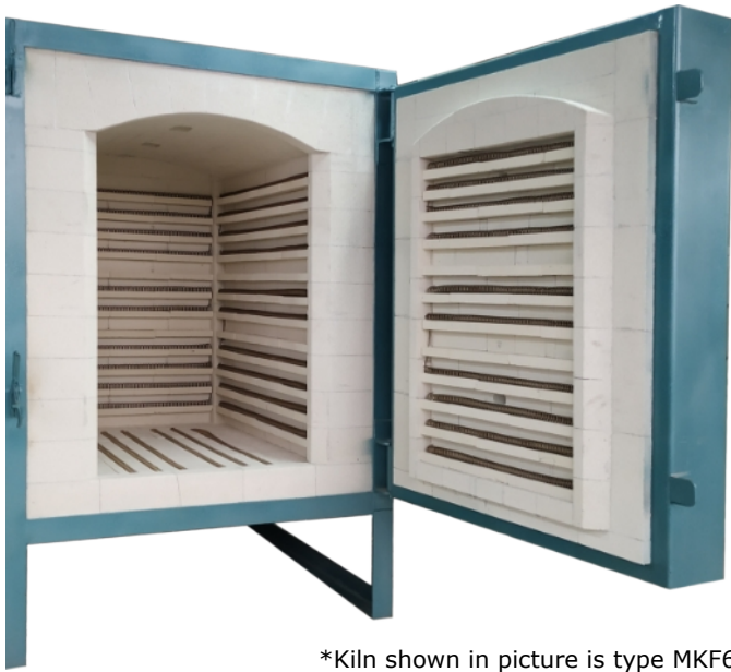
*Kiln shown in picture is type MKF600