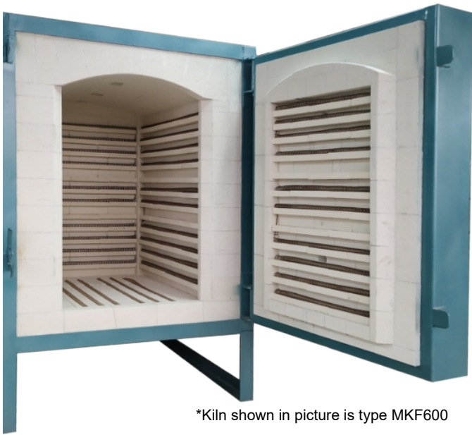
*Kiln shown in picture is type MKF600