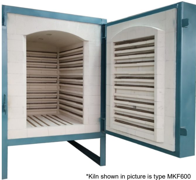
*Kiln shown in picture is type MKF600