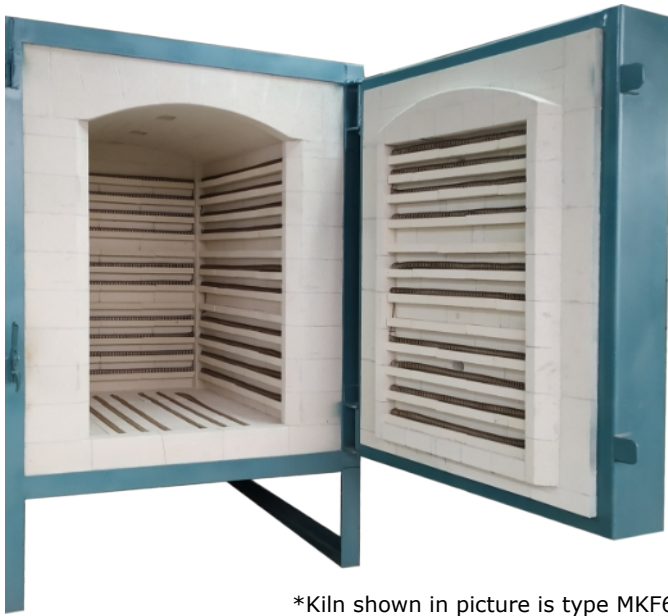
*Kiln shown in picture is type MKF600