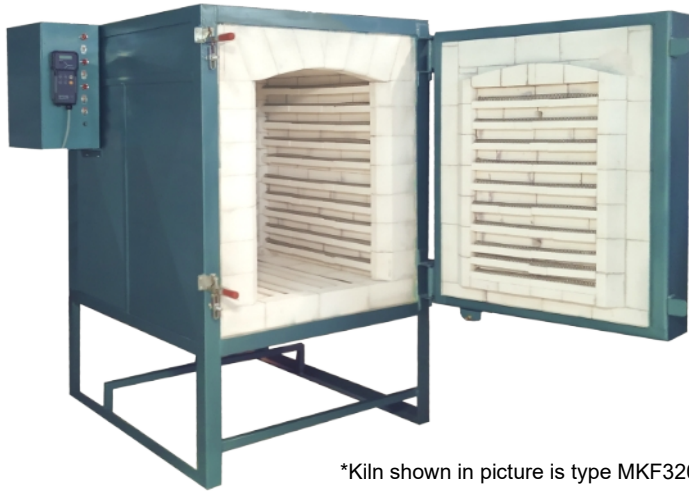
*Kiln shown in picture is type MKF320