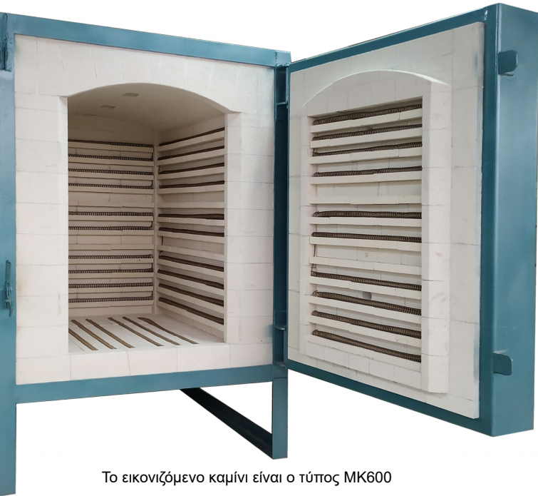
Το εικονιζόμενο καμίνι είναι ο τύπος MK600