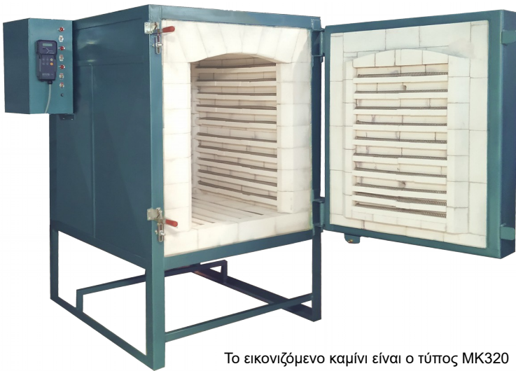
Το εικονιζόμενο καμίνι είναι ο τύπος MK320