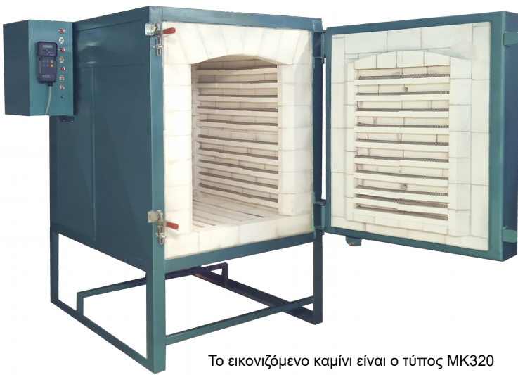
Το εικονιζόμενο καμίνι είναι ο τύπος MK320