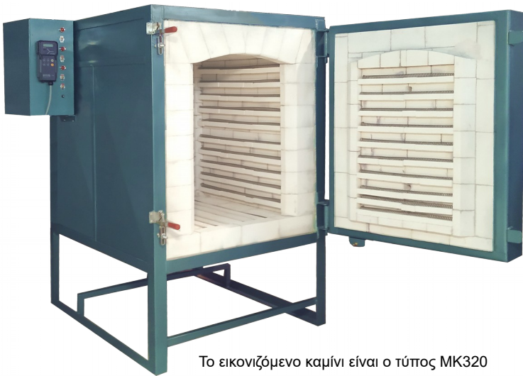
Το εικονιζόμενο καμίνι είναι ο τύπος MK320