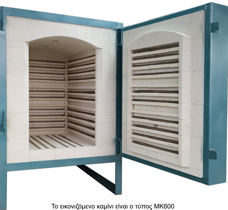
Το εικονιζόμενο καμίνι είναι ο τύπος MK600