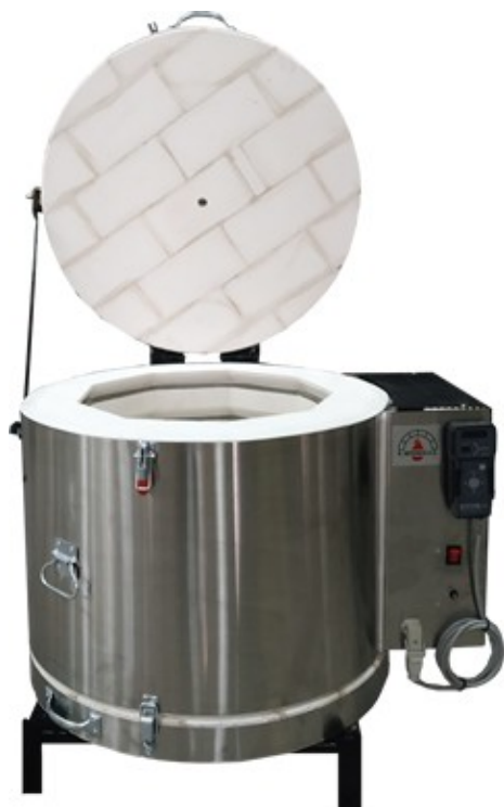
*Το εικονιζόμενο καμίνι είναι ο τύπος ΜΚ80